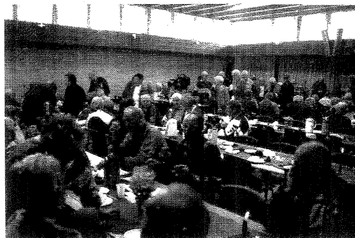
Deltagerne er så småt ved at fortrække fra morgenbordet i atri-umgården til fordel for kamppladsen i OB-hallen.